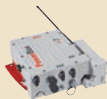
Leica PowerBox GNSS prijímač