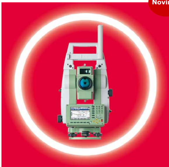
PinPoint vo vlajkovej lodi Leica – TPS1200+