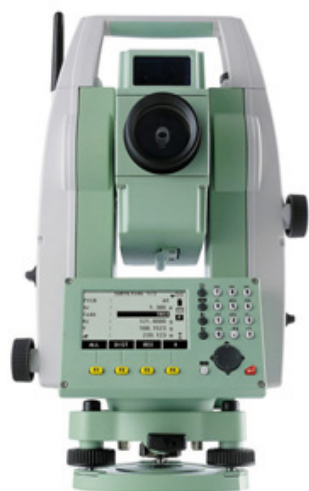
PinPoint v novom rade FlexLine

Najlepší výkon a presnosť bezhranolového diaľkomera na trhu. Merajte ťažko dosiahnuteľné ciele na vzdialenosť viac ako 1000 m – bezhranolovo a so skutočnou "PinPoint" presnosťou.